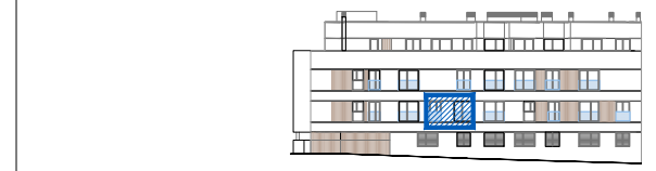
ALZADO C/ BUSTARVEJO